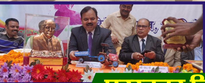
पुरस्कार वितरण समारोह